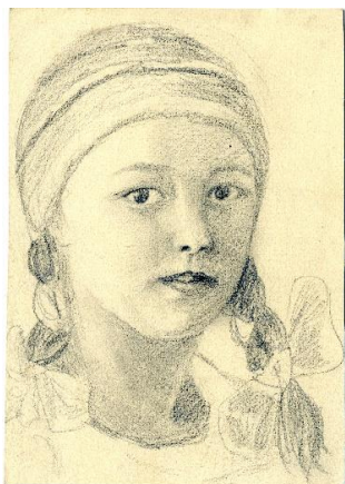
Автопортрет. 1935 г.